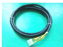
9 芯电缆线、端口插件实物图